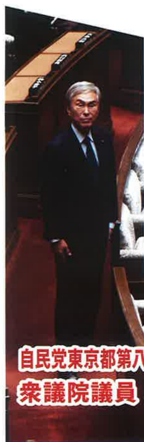
自民党東京都第八選挙区支部長 衆議院議員

日本選手が五輪で見せた諦めない気持ちと団結の力を、私達も持っています。皆さん、一緒に日本を元気にしましょう。経済のスペシャリスト・石原に力をお貸し下さい。